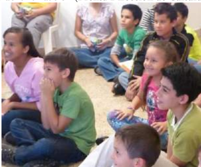
Los hijos e hijas del personal de la DCET y el Museo del Táchira disfrutaron de la obra teatral